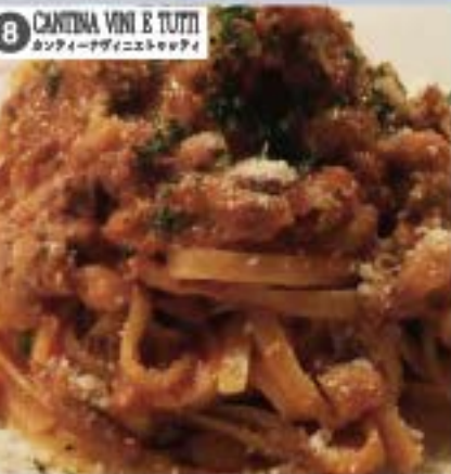
⑧ CANTINA VINI & TUTTI