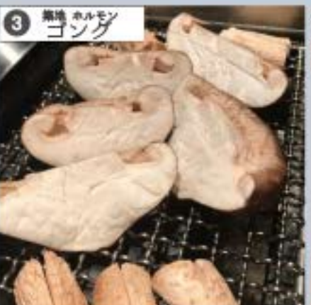
③ 無地 ホルモン ヨツダ