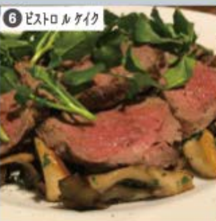
⑥ ビストロルケイク